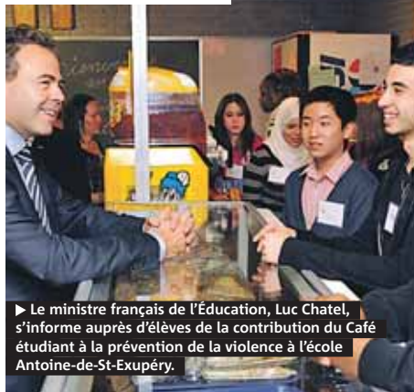
► Le ministre français de l'Éducation, Luc Chatel, s'informe auprès d'élèves de la contribution du Café étudiant à la prévention de la violence à l'école Antoine-de-St-Exupéry.